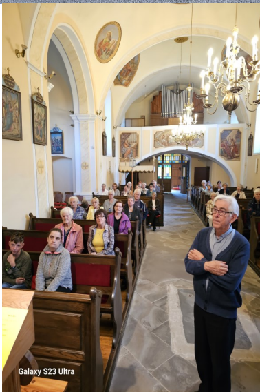
Galaxy S23 Ultra

V torek, 17. oktobra po večerni sveti maši smo v naših prostorih imeli srečanje za bralce Božje besede.